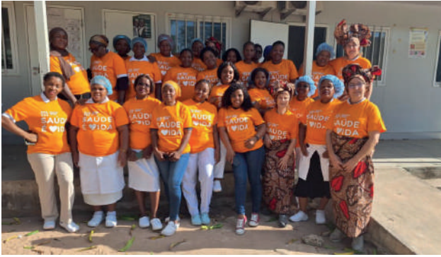
Centro de Saúde Mutava Rex: o agradecimento macua "com capulana e lenço"