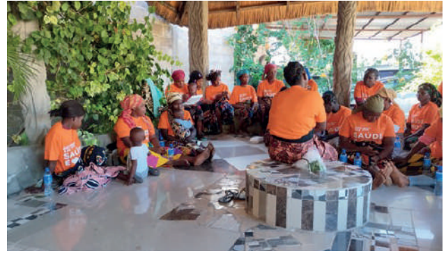
Formação na Comunidade "3 de Fevereiro": a hora do almoço