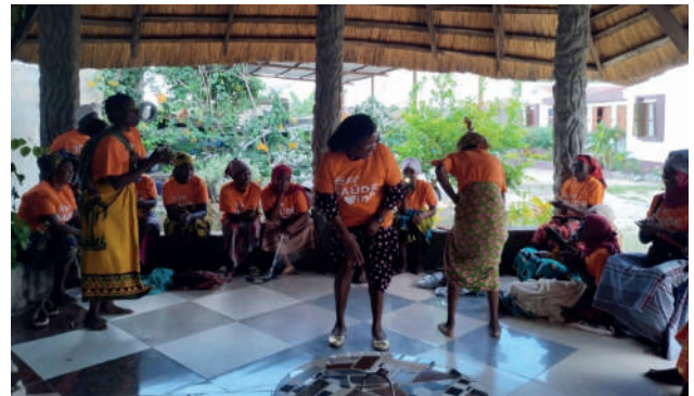
Formação na Comunidade "3 de Fevereiro": a hora da dança alusiva ao temas discutidos