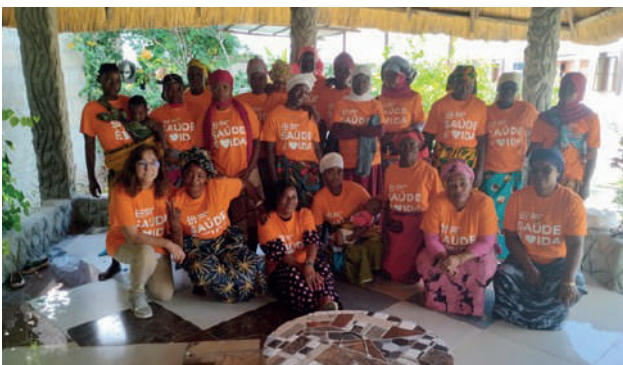
Formação na Comunidade "3 de Fevereiro": um dos grupos de formandas com a equipa da Health4Moz e as enfermeiras do Centro de Saúde Mutava Rex