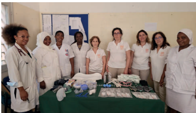
Centro de Saúde 25 de Setembro: oferta de material para equipar a sala de partos