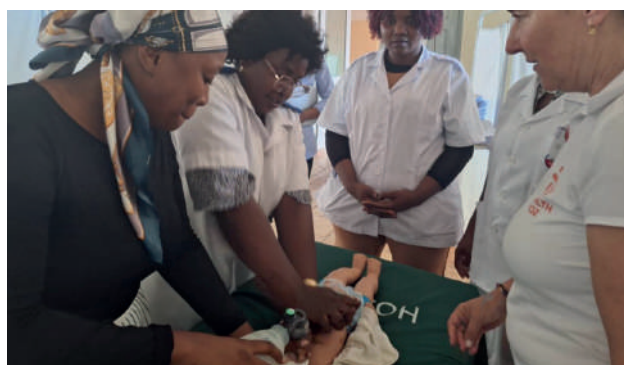
Centro de Saúde 25 de Setembro: formação em SBVP