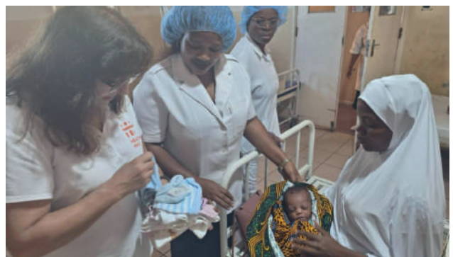
Centro de Saúde Mutava Rex: oferta de roupa aos recém-nascidos da maternidade