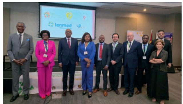
Comissão de Honra do Congresso das Ordens Médicas «dos PALOPs- Maputo