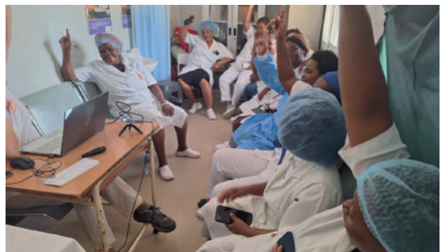
Centro de Saúde Mutava Rex: correcção do teste final