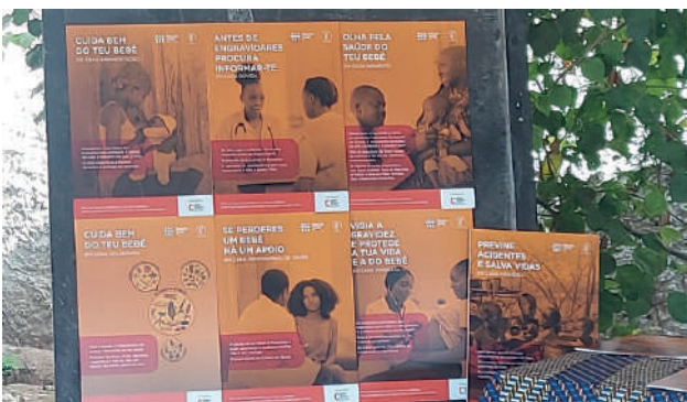
Murrapanuiua: alguns dos painéis com os temas a abordar com as mulheres da comunidade