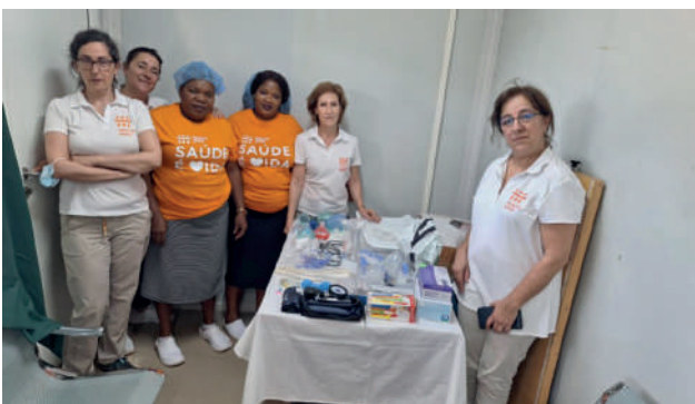
Centro de Saúde Mutava Rex: material oferecido para equipar a sala de partos