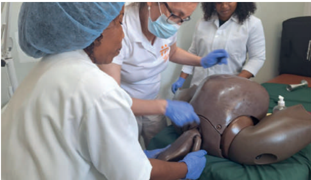
Centro de Saúde Mutava Rex: formação em assistência ao parto