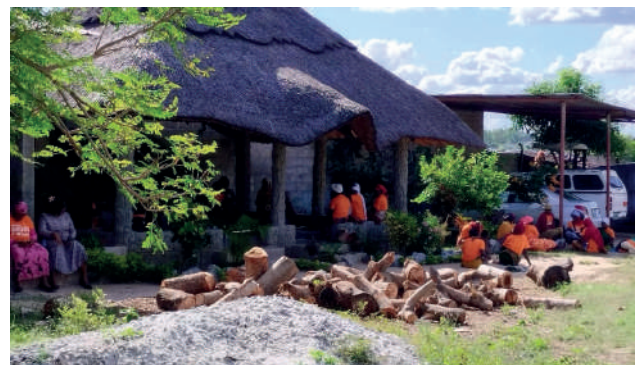
Formação na Comunidade de Murrapanuiua: a hora do almoço