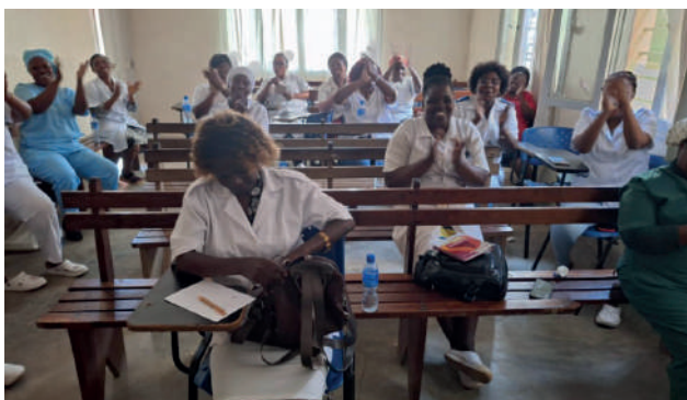
Centro de Saúde 25 de Setembro: correcção do teste pós-formação de um dos grupos de formandas