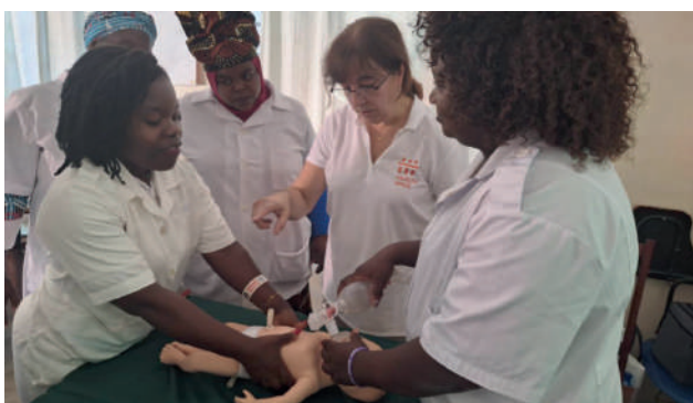
Centro de Saúde 25 de Setembro: formação em assistência ao recém-nascido