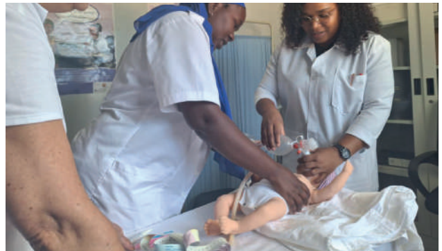
Centro de Saúde Mutava Rex: formação em assistência ao recém-nascido