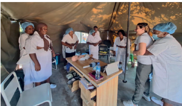
Centro de Saúde Mutava Rex: formação em SBVP