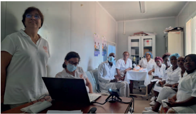
Centro de Saúde Mutava Rex: hora do pré-teste para um dos grupos de formandas