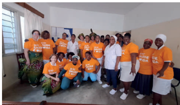
Centro de Saúde 25 de Setembro: "em homenagem à mulher macua a equipa recebeu uma capulana!